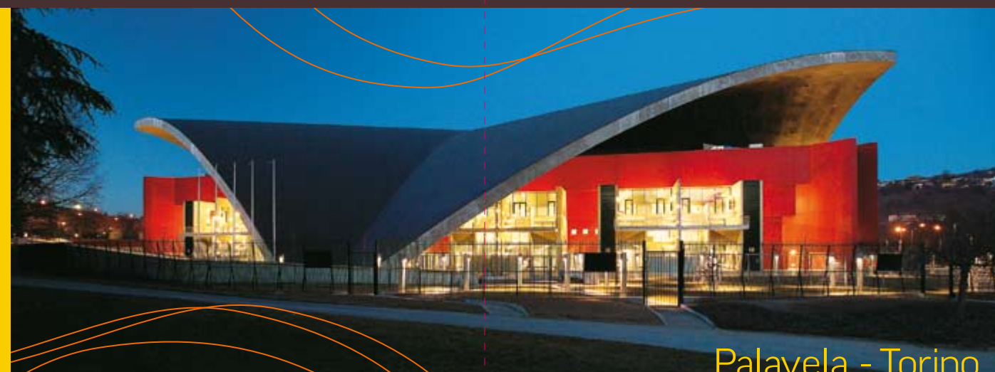
Palavela - Torino

www.torinolympicpark.org http://impiantisportivi.coni.it